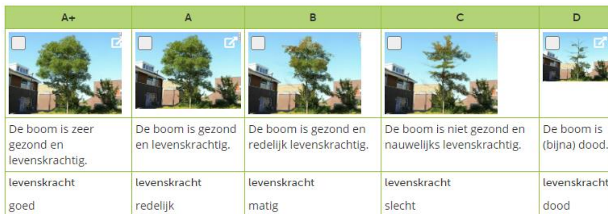
Voorbeeld beeldkwaliteit levenskracht bomen (CROW, 2018)

Bij het meten van de kwaliteit is het volgende meegenomen.